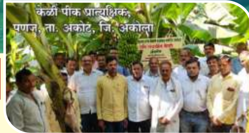
केळी पीक प्रात्यक्षिक, पणज, ता. अकोट, जि. अकोला