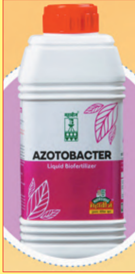
अॅझोटोबॅक्टर नत्रस्थिर करणारे जिवानू