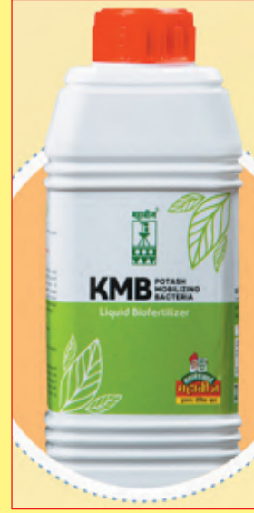
के.एम.बी. पालाश विरघळविणारे जिवानू