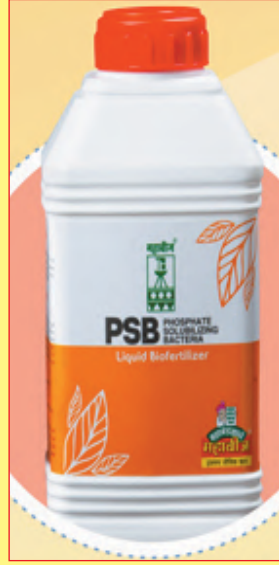
पी.एस.बी. स्फुरद विरघळविणारे जिवानू