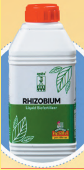
रायझोबीयम नत्रस्थिर करणारे जिवानू