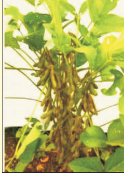
एएमएस एमबी ५-१८ (सुवर्ण सोया)