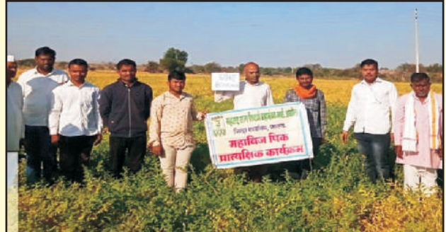
जिल्हा जालना गाव देवगांव हरभरा बीडीएनजीके-७९८