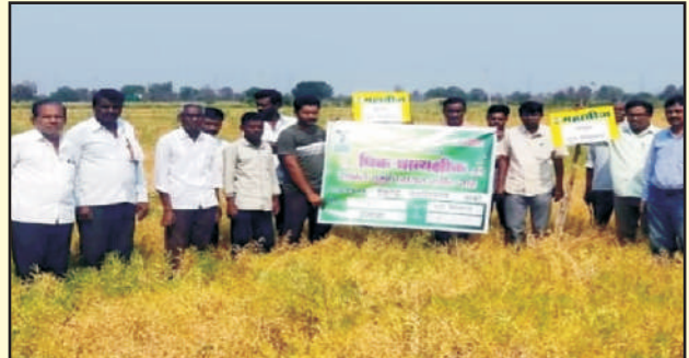
जिल्हा यवतमाळ मौजे इंझाला हरभरा फुले विश्वराज