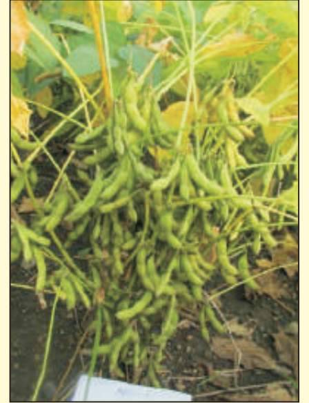
एएमएस १००१ (पिडीकेव्ही येलो गोल्ड)