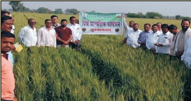
जिल्हा धुळे मौजे शिंदखेडा गहु फुले समाधान