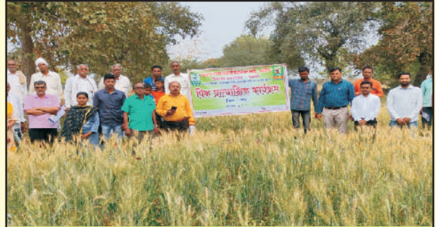
जिल्हा भंडारा गाव डोंगरगांव गहु एमएसीएस-६२२२