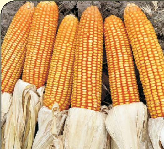
सं. मका एमएमएच-१७०८