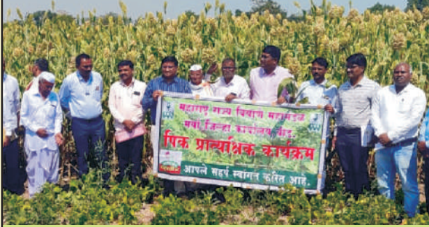
जिल्हा बीड गाव वैद्यकिन्ही रब्बी ज्वार फुले रेवती