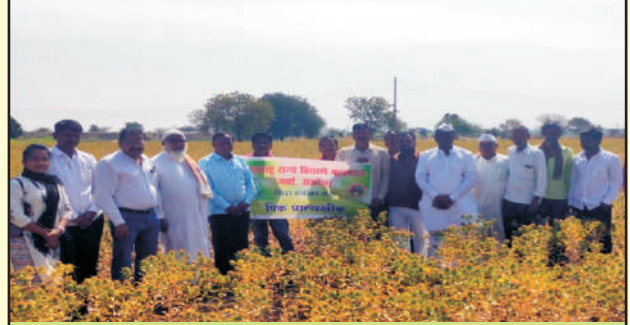
जिल्हा लातूर गाव धारोळा करडई एसएल-९३