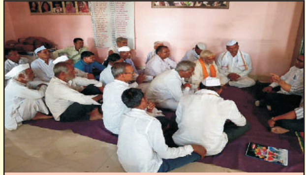
जिल्हा छत्रपती संभाजीनगर