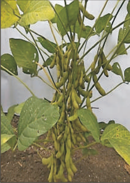
एएमएस १००-३९ (पिडीकेव्ही अंबा)