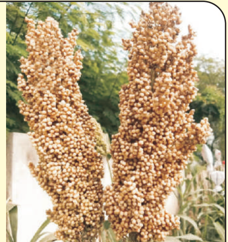
सं. ज्वारी महाबीज-७०४