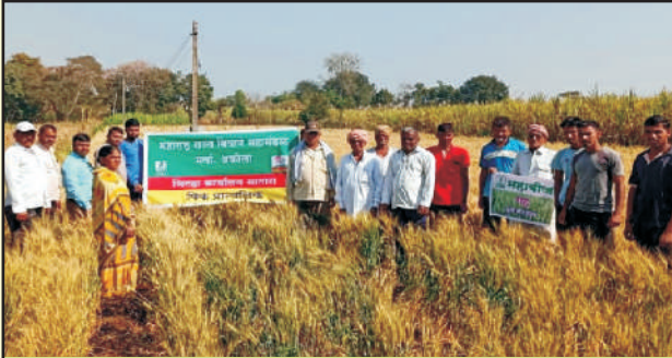
जिल्हा सातारा गाव धोंडेवाडी गहु फुले समाधान