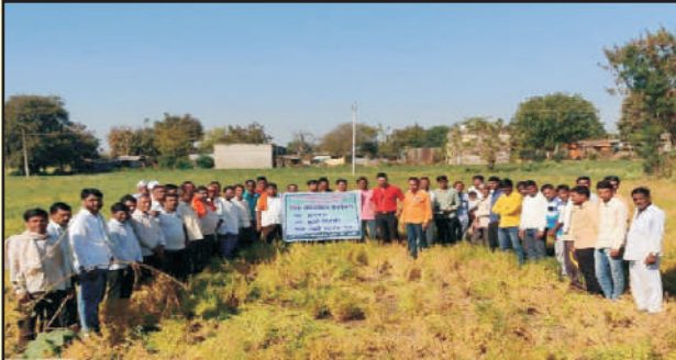
जिल्हा हिंगोली गाव सवना हरभरा फुले विक्रम